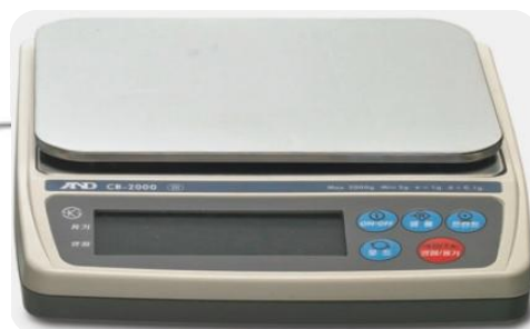
Bilancia elettronica integrata